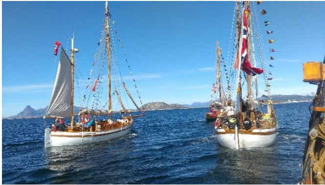
Makrellen under siste etappe til landsleiren i Bodø 2017

Følgende oppgaver vil være prioritert for den kommende sesong: